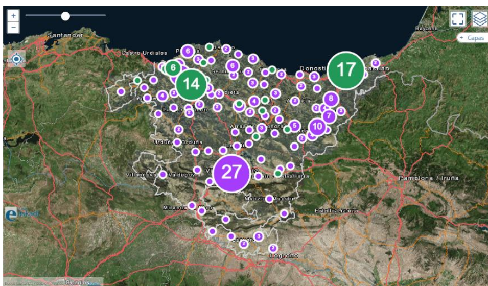
Euskadiko liburutegi publikoen direktorioa 9 .

Euskadiko Irakurketa Publikoko Sarea 7 (aurrerantzean, EIPS) 2007an sortu zen (11/2007 Legea, urriaren 26koa, Euskadiko Liburutegiei buruzkoa), eta toki-administrazioen mendeko liburutegi-sareen bateratze gisa eratu zen. Sare horiek beren borondatez integratuko dituzte beren liburutegi-zerbitzuen sailak herritar guztien eskura jartzen dituzten foru-liburutegiak, estatukoak eta pribatuak. Gaur egun, gure erkidegoko hiru lurraldeetako 286 8 liburutegi baino gehiago daude sarean.